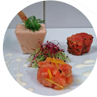
Variation sur le saumon 15,60€ par personne

Tome de Montagne Abondance Tome de Chèvre Confit de Figues