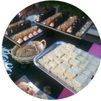
Charcuteries/Fromages 14,50€ par personne

Jambon Fumé de Savoie Coppa Rosette Mortadelle à la Truffe Mini Pâté Croute