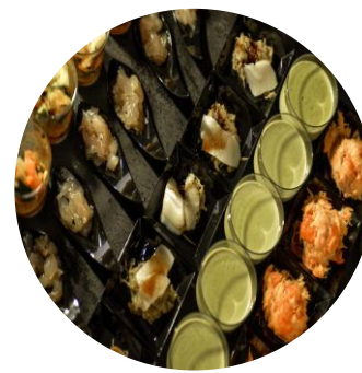
Végétarien 13,10€ par personne

Gravlax Crème Légère au Raifort en Tartelette Cœur de Focaccia Saumon Fumé Rillettes de Saumon Mini Wrap Saumon Fumé Mini Caroline Crème de Saumon